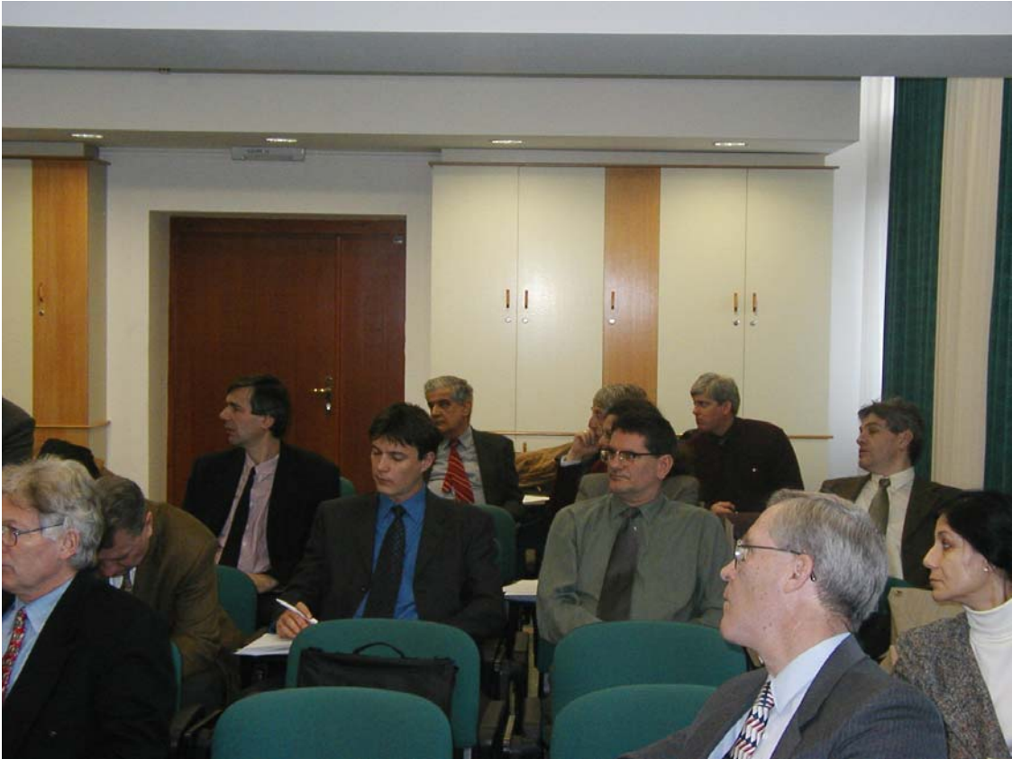
Slika 2. Na sastanku Upravnog odbora u Skopju